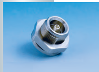
BN 98 17 22