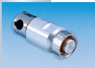
BN 45 03 68