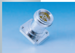
BN 98 17 03