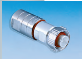
BN 45 03 59