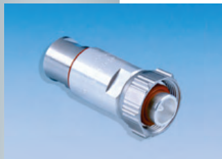
BN 45 03 44